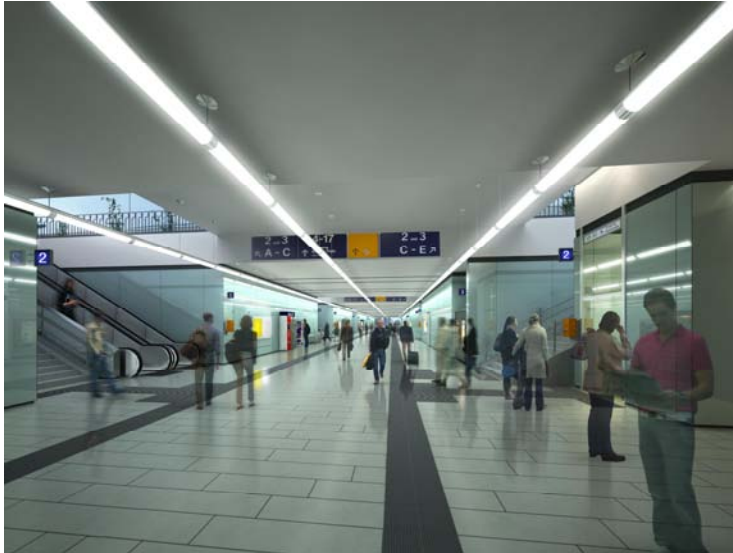
Visualisierung PU Süd