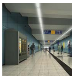
Visualisierung PU Süd